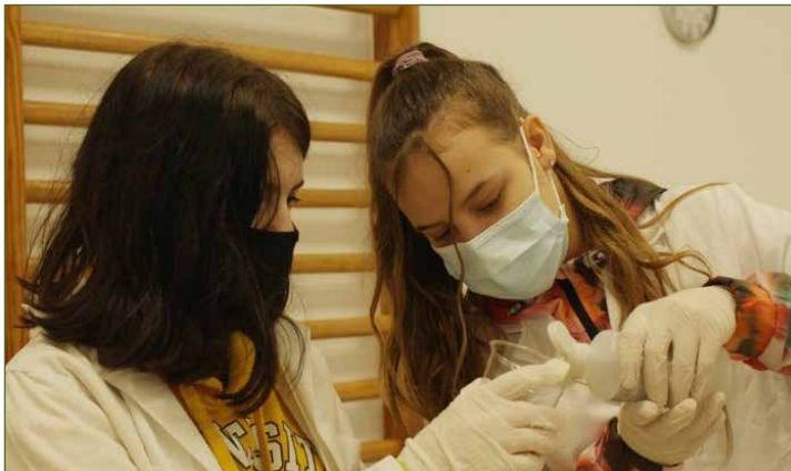
Becas STEM - Empieza por educar