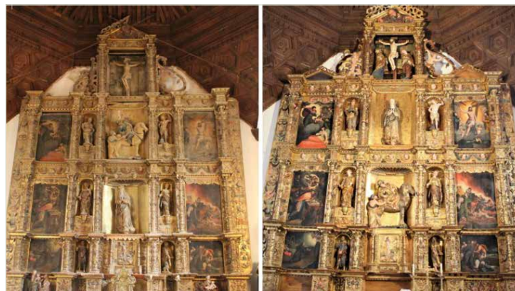
Retablo Villarmentero de Campos

Los principales trabajos llevados a cabo han supuesto el desmontaje del retablo; la adecuación del testero y bancada de obra; trabajos de carpintería de restauración y consolidación estructural; tratamientos de asentado de aparejos y policromías y limpieza, reintegración cromática y montaje del retablo con la reubicación de las esculturas en el mismo. Además, esta intervención ha permitido ahondar y profundizar en el conocimiento de las técnicas artísticas y constructivas utilizadas por los talleres de los artistas que han realizado el retablo.