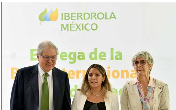
Entrega Beca Internacional en México