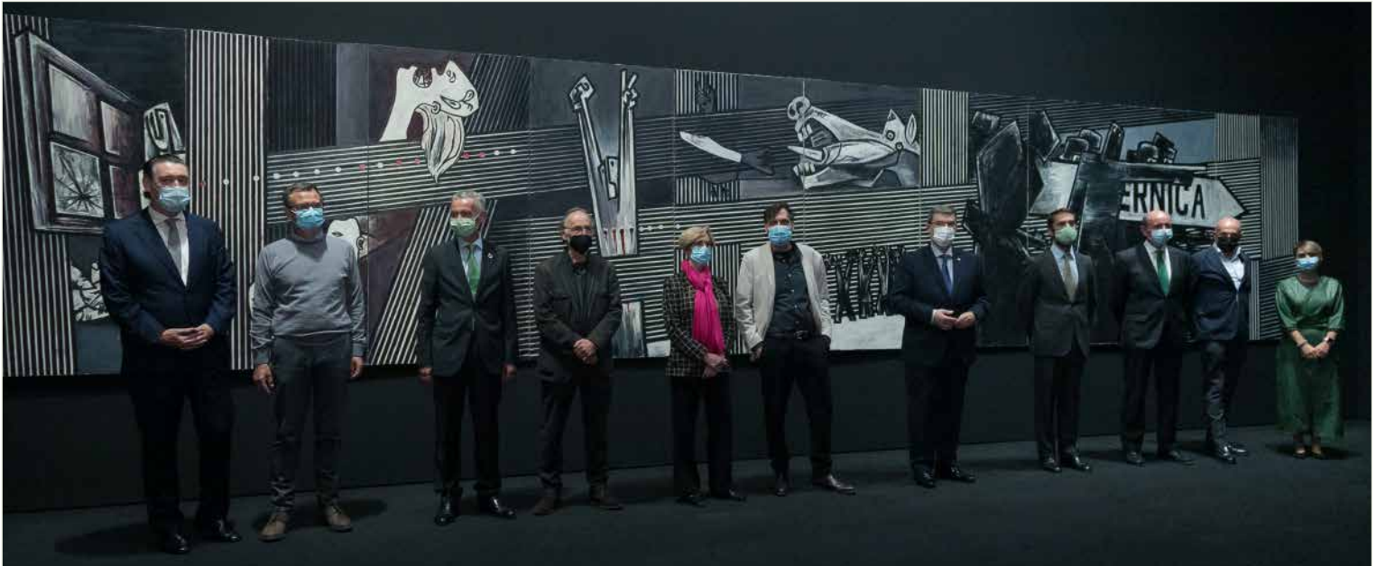
Guernica de Agustín Ibarrola