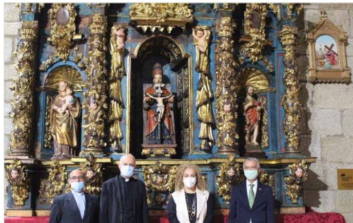
Restauración del Retablo de San Antonio de Padua

Entro otras actuaciones, se ha procedido a la limpieza mecánica de los restos orgánicos acumulados, la fijación del estrato pictórico, el tratamiento contra insectos xilófagos, la carpintería estructural y la restauración del retablo.