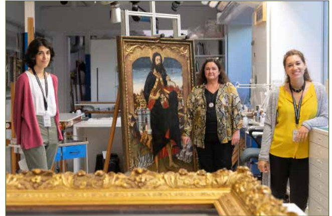
Museo de Bellas Artes de Bilbao