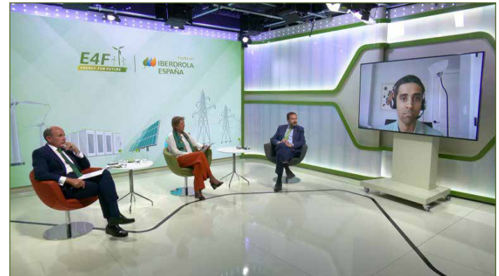
Energy for Future