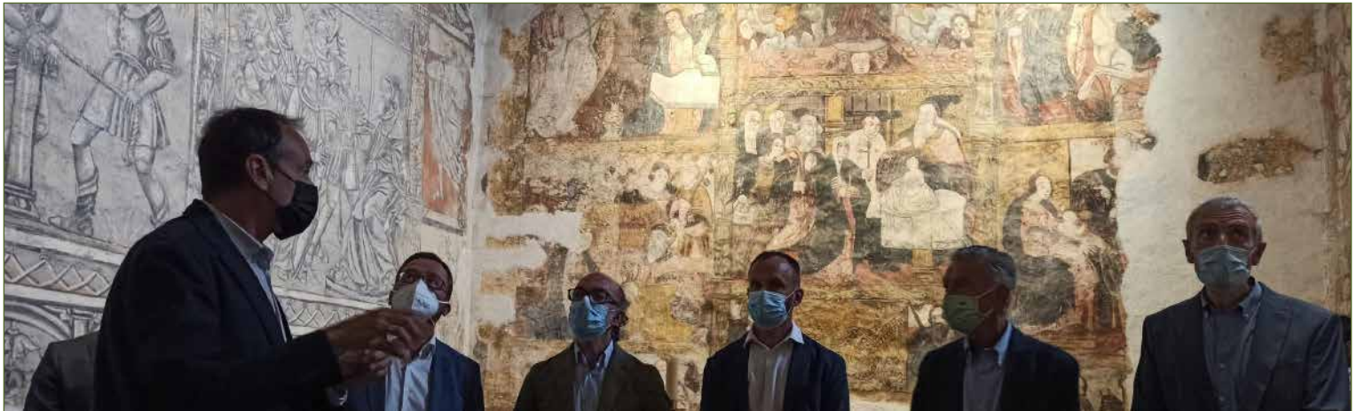
Iglesia salmantina de Carrascal de Velambélez