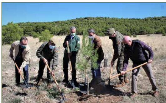
Campo de maniobras de Chinchilla

Inauguración de la reforestación del Campo de Maniobras de Chinchilla . Esta reforestación, la tercera que acomete la fundación dentro del plan Bosque Defensa-Iberdrola , ha supuesto la plantación a lo largo de una superficie cercana a 20 hectáreas de 17.000 árboles autóctonos, de los que un son 80% pinos y el 20% restante encinas – provienen del vivero “El Sembrador”, que desarrolla acuerdos con ONG para apoyar la inserción laboral de mujeres en riesgo de exclusión social. Estos árboles absorberán más de 2.500 toneladas de CO 2 a lo largo de su vida.