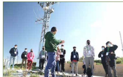
Visita al Campus de San Agustín de Guadalix