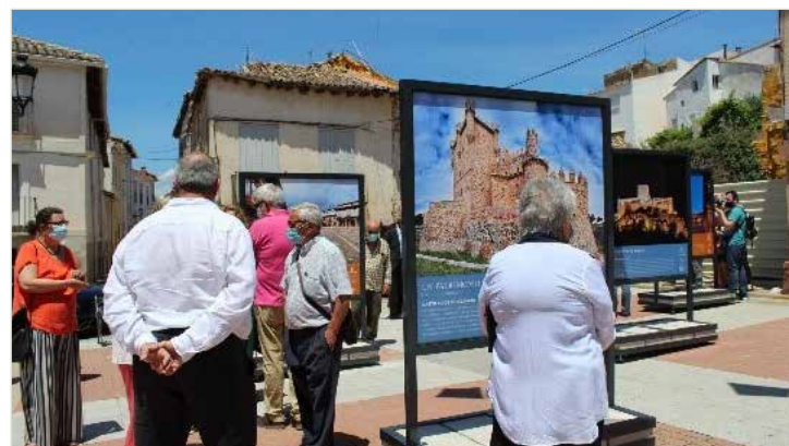
Un Patrimonio de todos