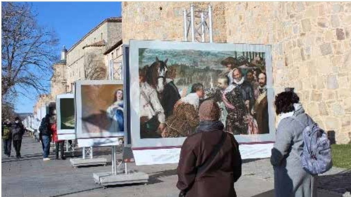
Prado en las calles

Tras el éxito de la exposición en Castilla – La Mancha, en 2021 – 2022 se traslada la exposición a nueve provincias de la región de Castilla y León: Salamanca, Valladolid, León, Aguilar de Campoo, Burgos, Soria, Segovia, Ávila y Benavente.