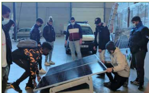
Montaje de Placas Fotovoltáicas

El proyecto tiene una duración de 11 semanas en las que se impartirán varios módulos relacionados con la Economía verde, como la Eficiencia Energética, la Domótica, el Vehículo Eléctrico, el Montaje y mantenimiento de instalaciones fotovoltaicas y Técnicas de Reforestación, entre otras enseñanzas. Algunas entidades encargadas de impartir este contenido, además de Iberdrola, serán: Save the Children, Fundación Tomillo, Reforesta o Fundación GFM Renovables.