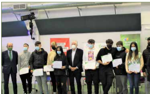
Entrega Diplomas Proyecto Inspira